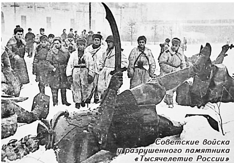
Советские войска разрушают памятник «Тысячелетие России»

20 января Великий Новгород отмечал памятную дату — 77-летие со дня освобождения от фашистской оккупации. Большую помощь в восстановлении города оказали боровичане.