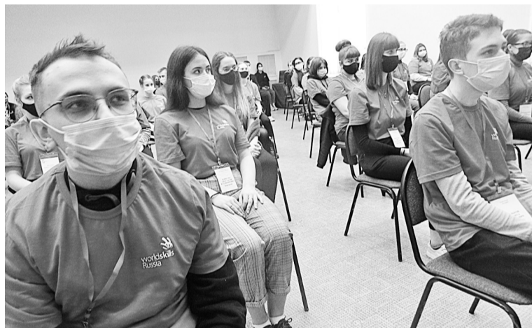
На открытии чемпионата в педагогическом колледже

В этом году студенты соревновались по 75 дисциплинам. Среди