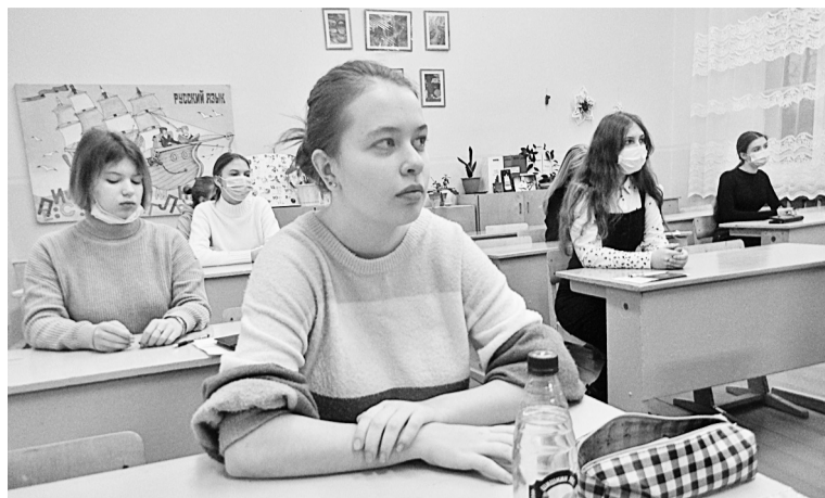
На олимпиаде по литературе

Кто дружит с метафорой, писал литературу. Кто легко берёт интегралы, решал матема-