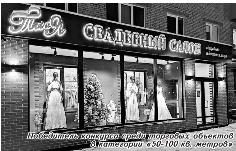
Победитель конкурса среди торговых объектов в категории «50-100 кв. метров»

Подведены итоги городского конкурса на лучшее праздничное оформление объектов потребительского рынка к Новому, 2021 году.