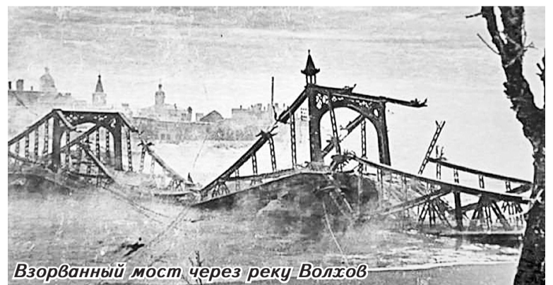
Взорванный мост через реку Волхов

Для весеннего сева 1944 года из сёл Боровичского района был отправлен семенной фонд (картофель, зерно), сельхозинвентарь (плуги, телеги, веялки, молотилки, бороны, упряжь и т.д.). По городу и району был организован сбор вещей, книг, денег. Целые бригады строителей, пахарей выехали весной 1944 года в